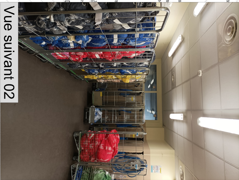
Vue suivant 02