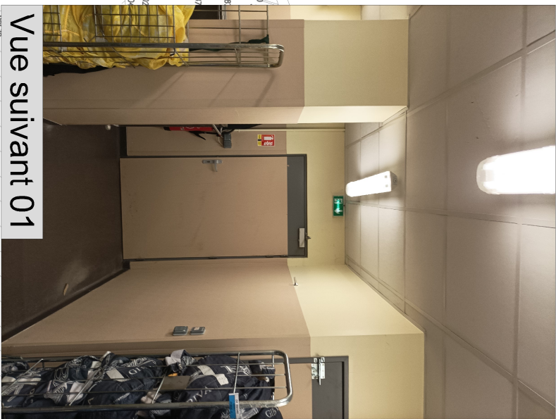
Vue suivant 01